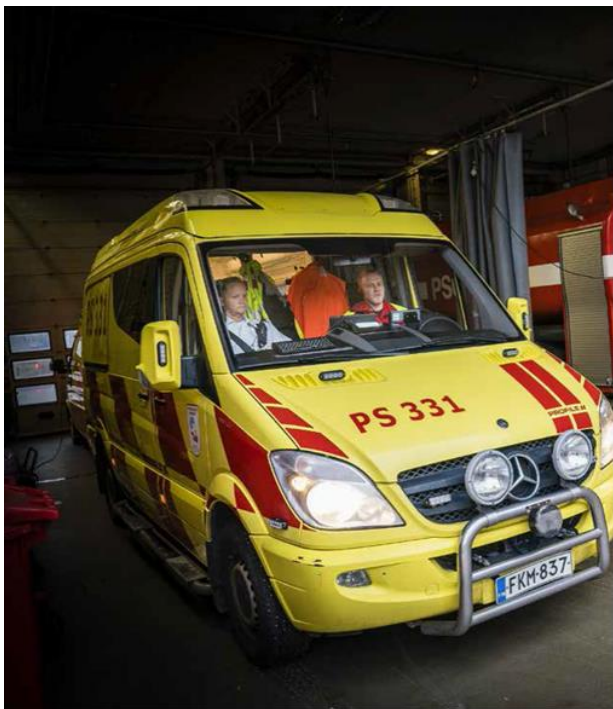
Aake Roininen /Savon Sanomat